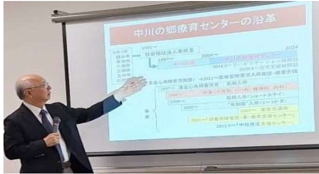
講演会：施設説明の様子