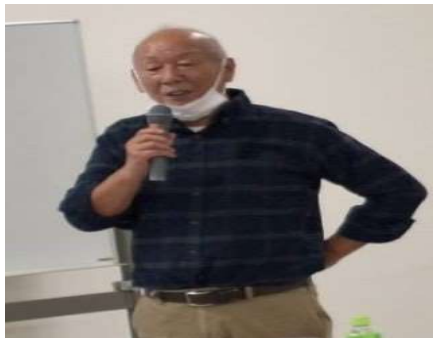
棚沢施設部会長 あいさつ