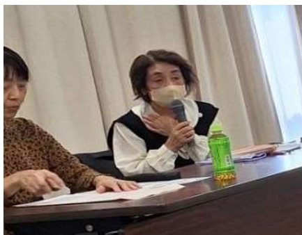
中下会長 あいさつ